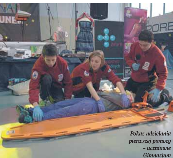
Pokaz udzielania pierwszej pomocy – uczniowie Gimnazjum