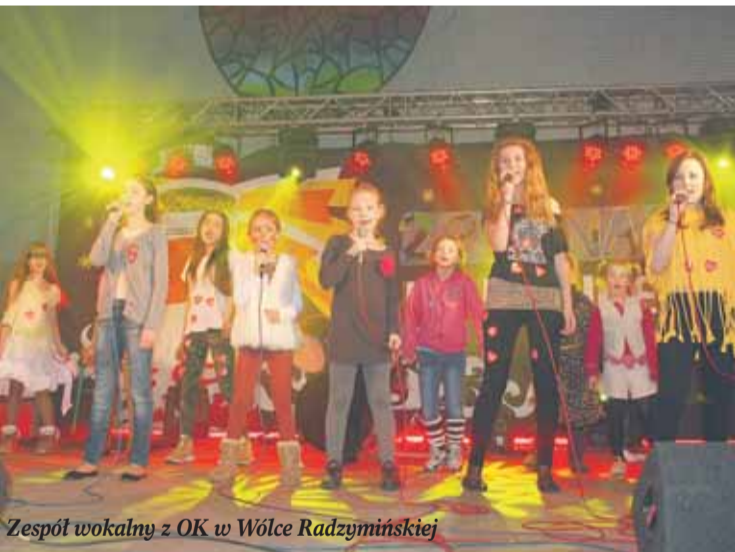
Zespół wokalny z OK w Wólce Radzywińskiej