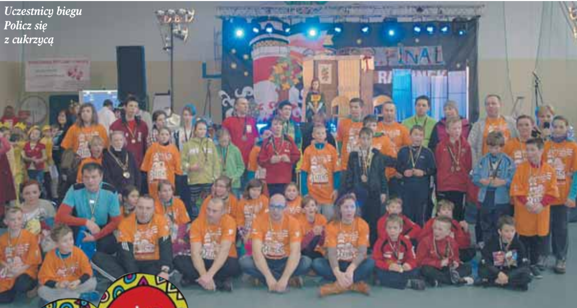
Uczestnicy biegu Policz się z cukrzycją