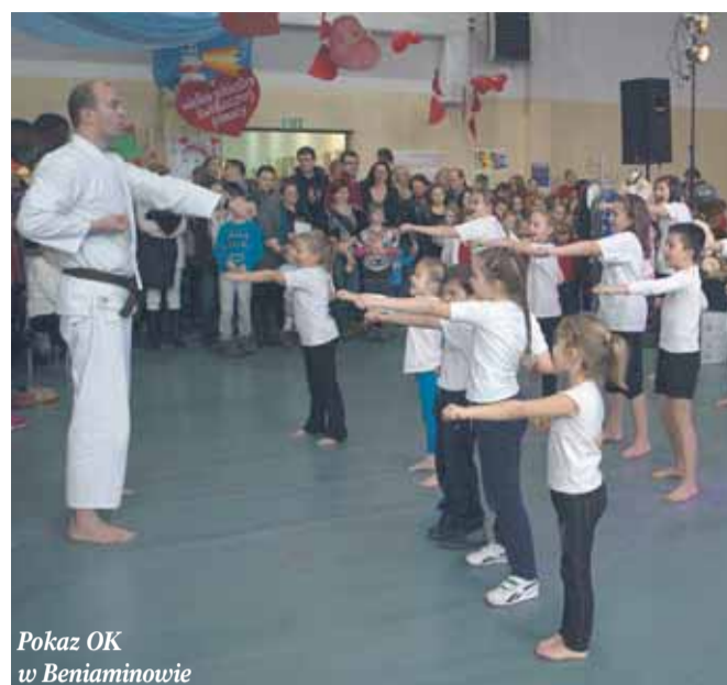
Pokaz OK w Benjaminowie