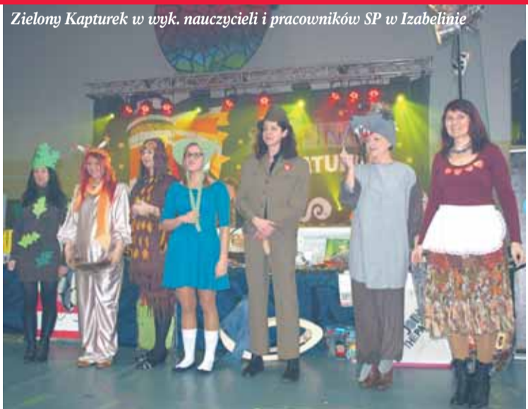
Zielony Kapturek w wyk. nauczycieli i pracowników SP w Izabelinie