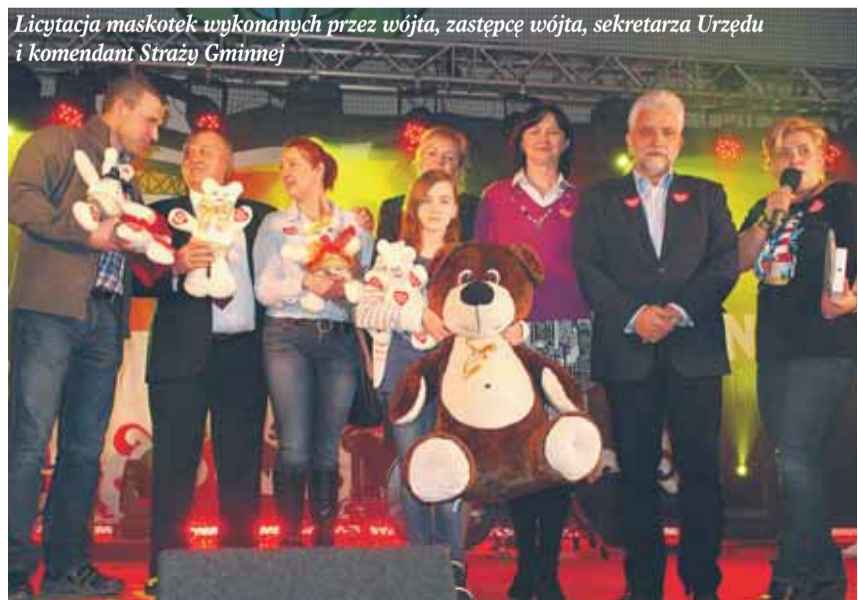
Licytacja maskotek wykonanych przez wójta, zastępcę wójta, sekretarza Urzędu i komendant Straży Gminnej