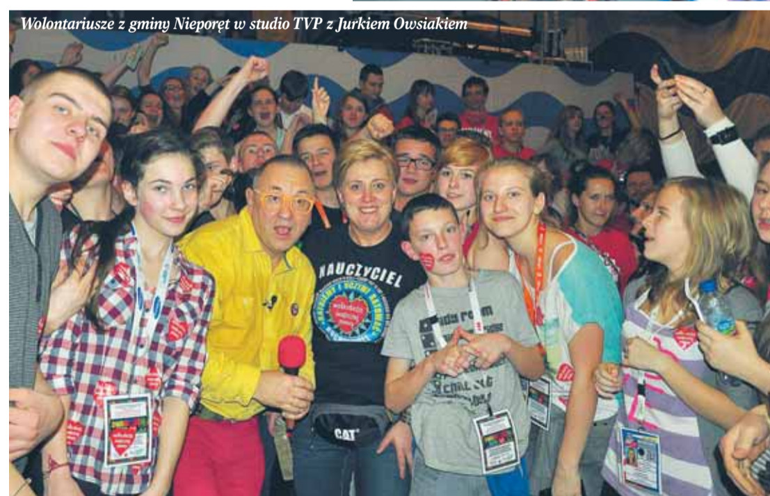
Wolontariusze z gminy Nieporęt w studio TVP z Jurkiem Owsakiem