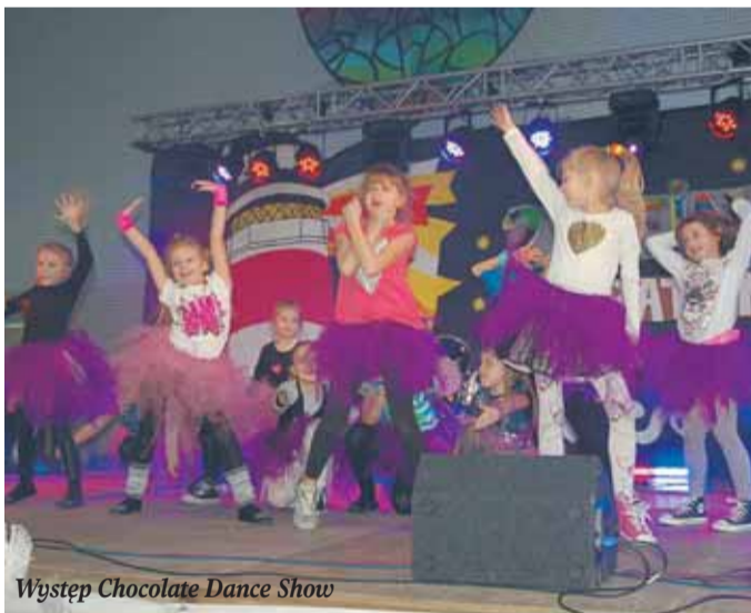
Występ Chocolate Dance Show