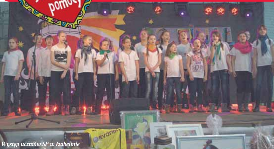
Występ uczniów SP w Izabelinie