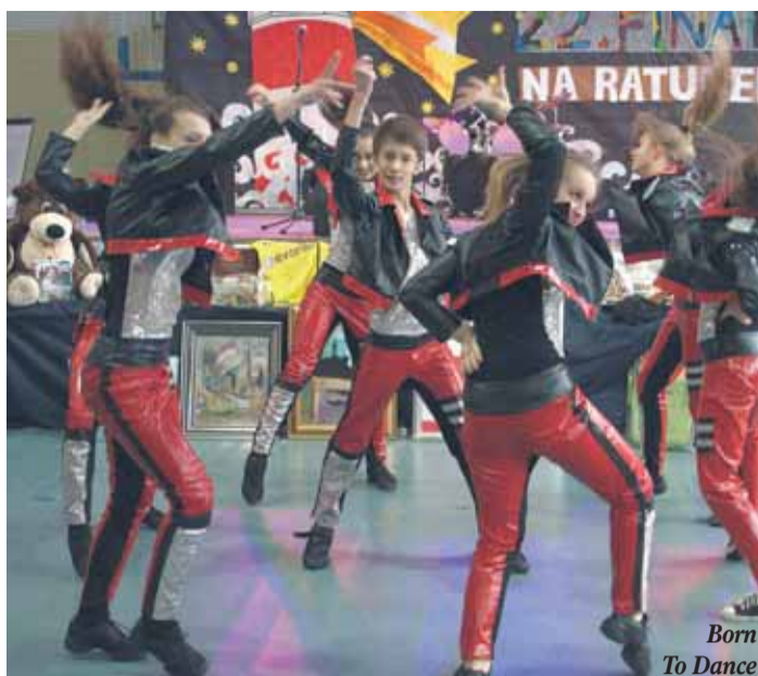
Born To Dance