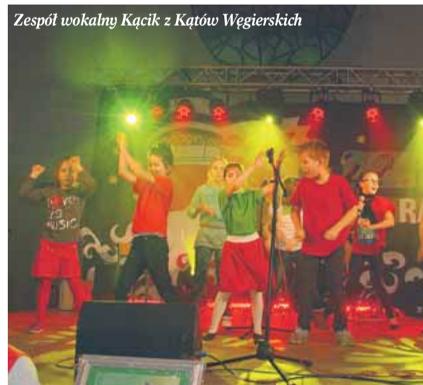
Zespół wokalny Kącik z Kątów Węgierskich