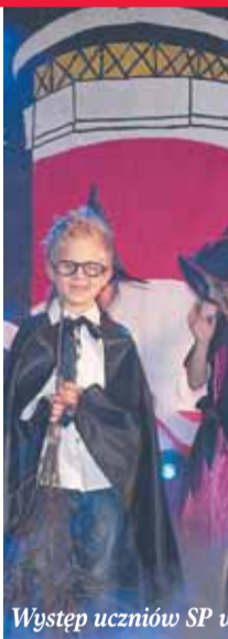
Występ uczniów SP w N...