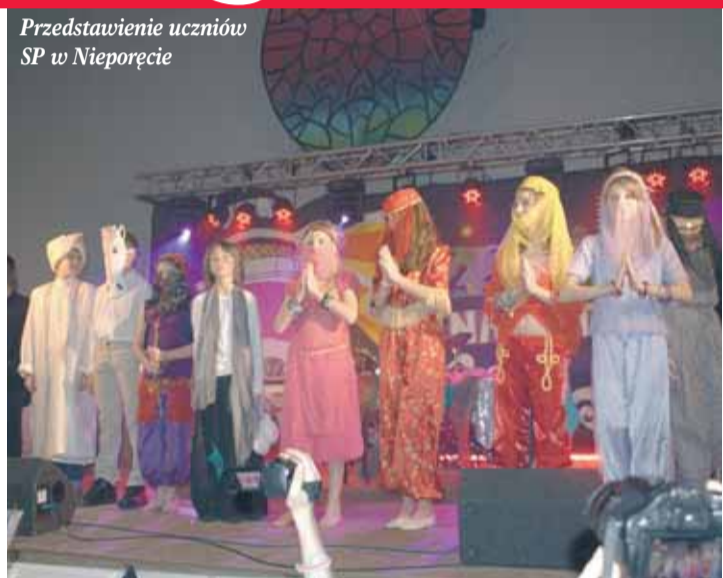
Przedstawienie uczniów SP w Nieporęcie