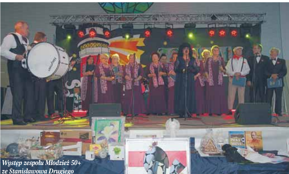
Występ zespołu Młodzież 50+ ze Stanisławowa Drugiego