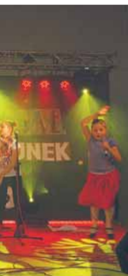
Występ uczennic SP w Białobrzegach